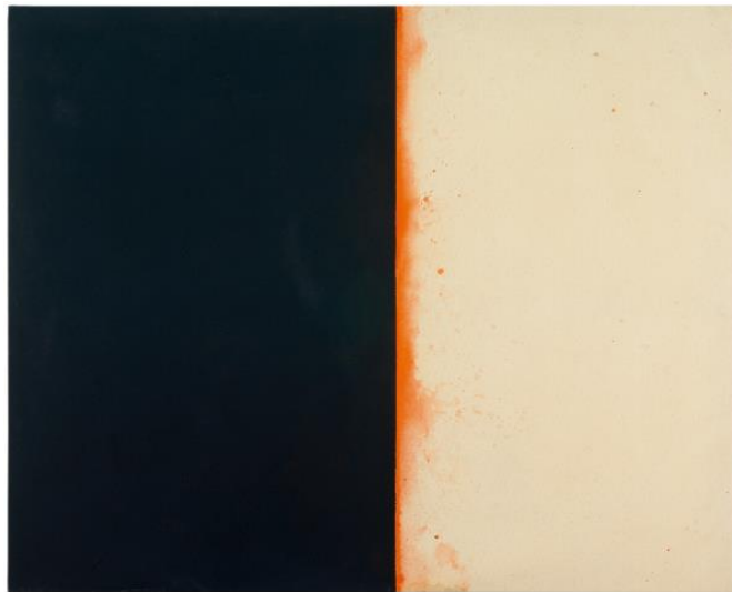
Alfons Borrell, 20-IX-06, 2006. Galeria Joan Prats, Barcelona

Alfons Borrell. Los trabajos y los días es un ensayo expositivo que se aproxima a los aspectos fundamentales de la obra de uno de los máximos representantes de la abstracción pictórica en Cataluña. Comisariada por Oriol Vilapuig, la muestra reúne cerca de 200 obras, entre pinturas, dibujos y grabados, que ilustran la evolución artística de Borrell desde mediados de los años cincuenta hasta la actualidad. El relato recupera también el film Aigua fosca que Borrell realizó en 1964 en torno a su concepción de la naturaleza como motor para la transformación artística.