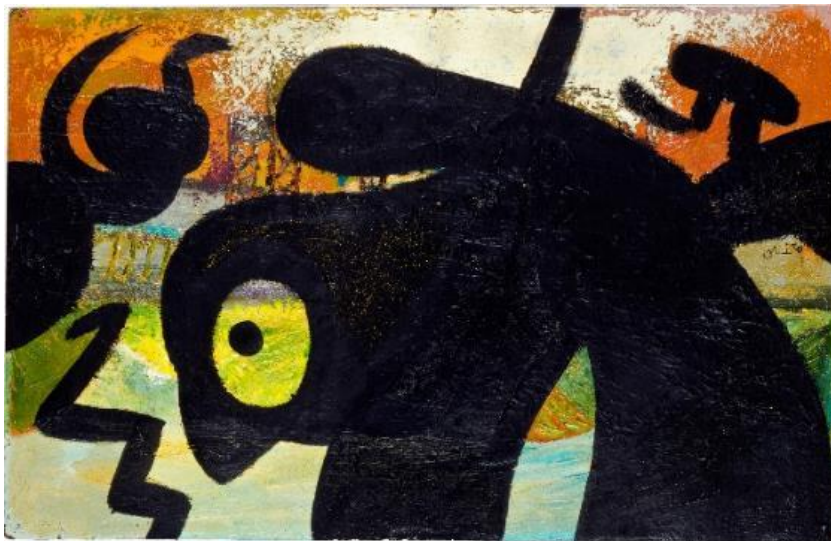
Joan Miró. Personnage, oiseaux , 1973. Fundació Joan Miró, Barcelona

2 de septiembre – 14 de noviembre de 2015