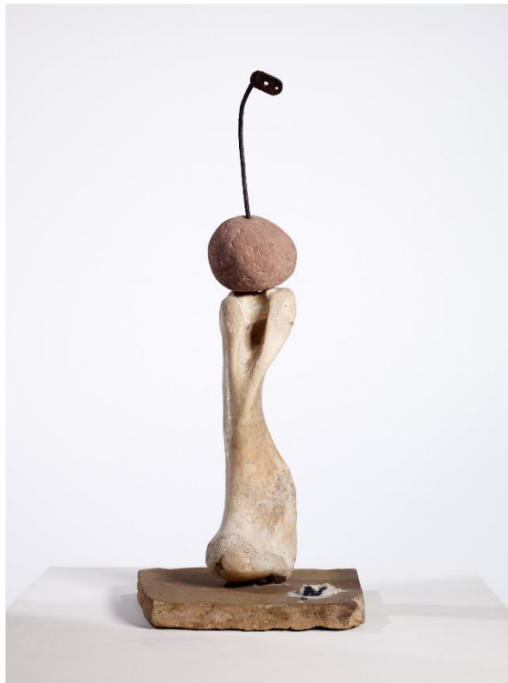
Joan Miró. Mujer , 1946