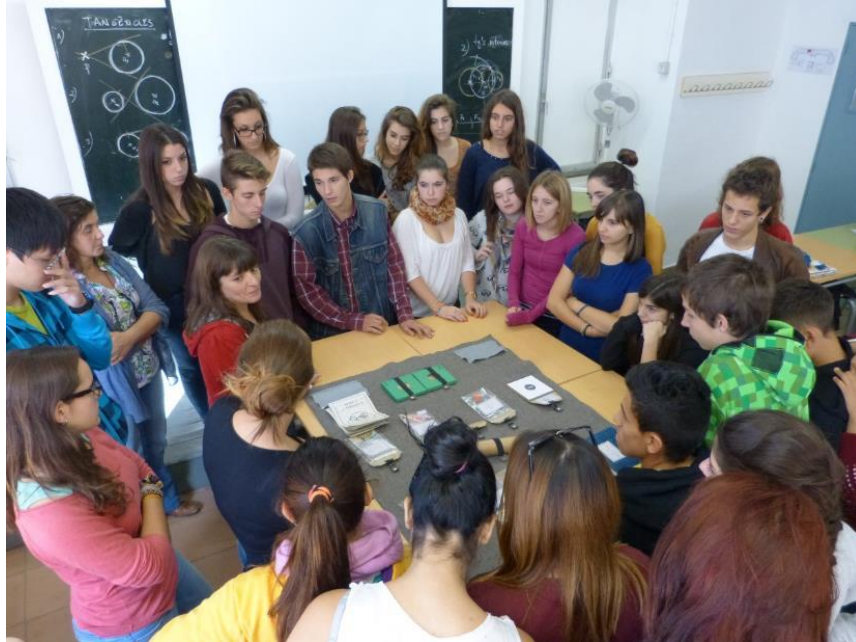
© Fundació Joan Miró. Foto. Pere Pratdesaba

La Fundació Joan Miró ofrece un programa de actividades educativas vinculado a su colección, al edificio de la Fundació y a las exposiciones temporales. El programa incluye visitas comentadas, visitas dinamizadas, talleres de artes plásticas y arquitectura, así como espectáculos y otras actividades.