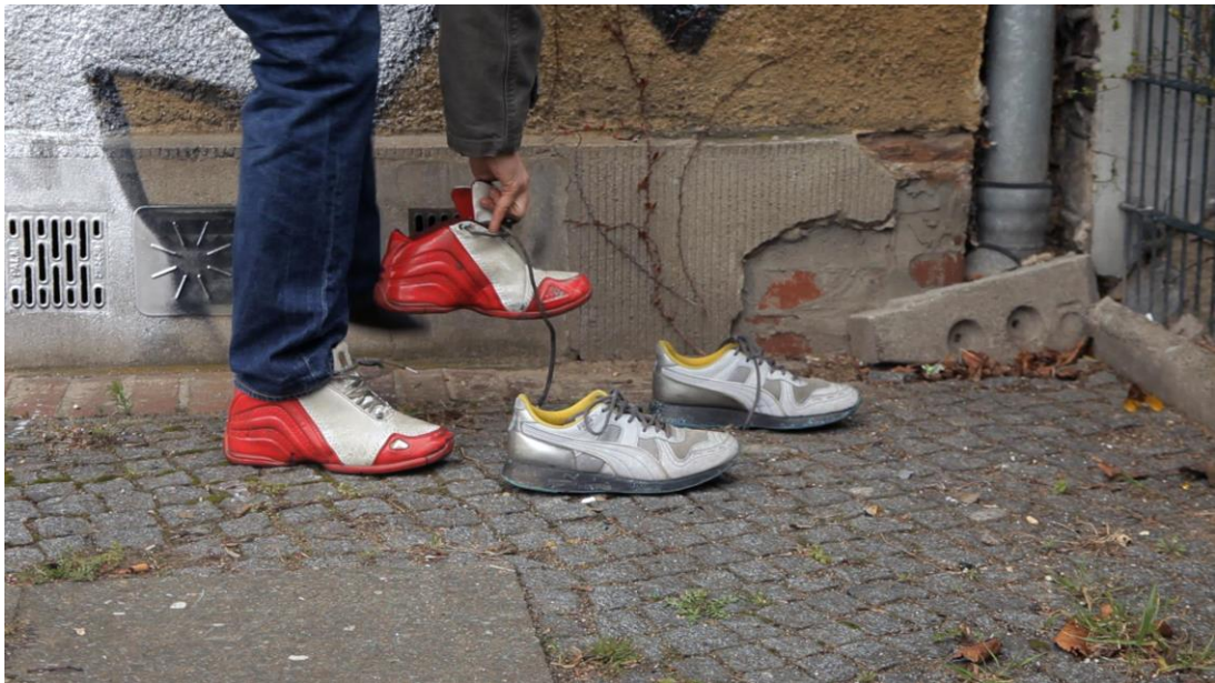
Fotograma de Trucking, 2015