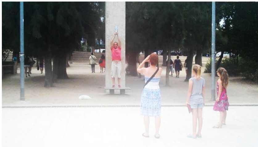
Avinguda de l'Estadi, Jardins de Montjuïc. Barcelona, agost de 2013. Fotograma de Doble autorització , Lola Lasurt, 2014.

La força de la ciutadania sovint és la base de la memòria col·lectiva. Moltes commemoracions històriques són liderades per iniciatives populars.