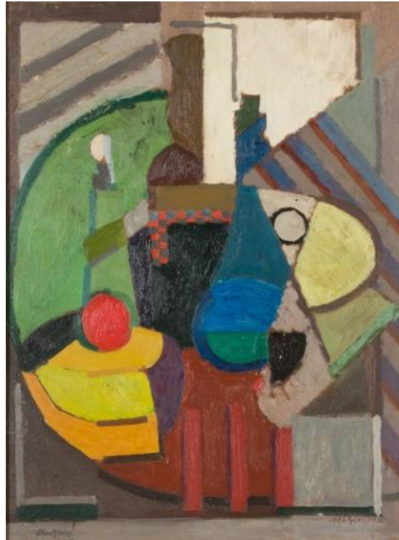
Albert Gleizes. Nature morte aux bouteilles , 1916. Col·lecció particular