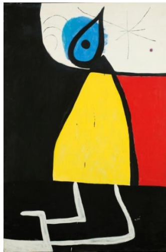
Joan Miró. Femme dans la nuit , 1973 Fundació Joan Miró, Barcelona

Més de cent obres de Joan Miró, la majoria provinents del fons de la Fundació Joan Miró, viatgen a Santiago de Xile amb el títol Joan Miró. La fuerza de la materia . L'exposició, preparada per la Fundació, es pot veure durant gairebé tres mesos a la Fundación CorpArtes. La mostra planteja la importància de la matèria en l'obra de Joan Miró a partir d'una selecció d'obres creades entre 1931 i 1981. Mitjançant un ampli recull de pintura, escultura i obra gràfica, s'explora l'interès de Miró per la matèria, com una finalitat en ella mateixa i com a via per a l'experimentació de noves tècniques i procediments innovadors.