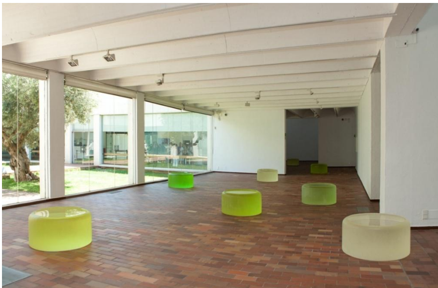
Imatge de les sales de l'exposició Roni Horn. Dormia tot com si l'univers fos un error

Exposició organitzada per la Fundació Joan Miró i l'Obra Social "la Caixa"