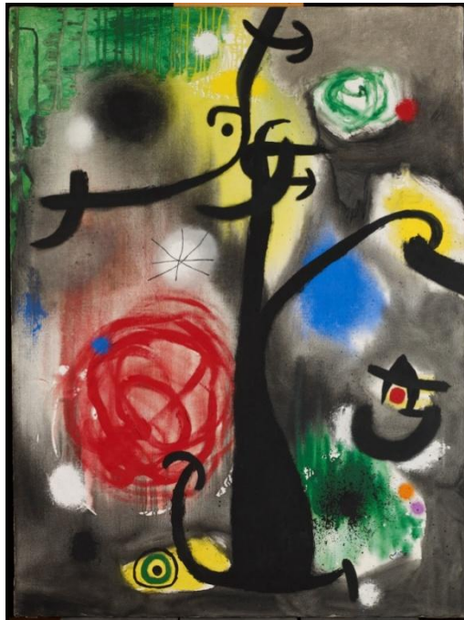
Joan Miró. Femme et oiseaux dans la nuit , 1968