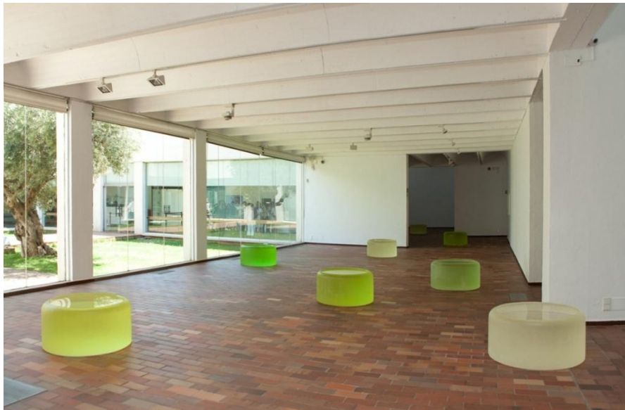
Imagen de las salas de la exposición Roni Horn. Dormía todo como si el universo fuera un error

Exposición organizada por la Fundació Joan Miró y la Obra Social "la Caixa"