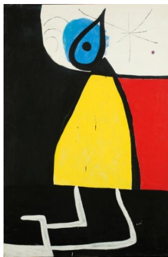
Joan Miró. Femme dans la nuit , 1973 Fundació Joan Miró, Barcelona

Más de cien obras de Joan Miró, la mayoría procedentes del fondo de la Fundació Joan Miró, viajan a Santiago de Chile bajo el título Joan Miró. La fuerza de la materia . La exposición, preparada por la Fundació, puede verse durante casi tres meses en la Fundación CorpArtes. La muestra plantea la importancia de la materia en la obra de Joan Miró a partir de una selección de obras creadas entre 1931 y 1981. Mediante una amplia selección de pintura, escultura y obra gráfica, se explora el interés de Miró por la materia, como una finalidad en sí misma y como vía para la experimentación de nuevas técnicas y procedimientos innovadores.