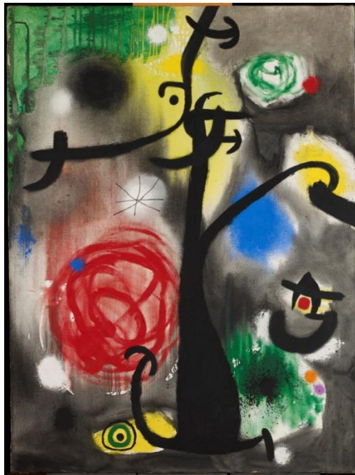
Joan Miró. Femme et oiseaux dans la nuit , 1968