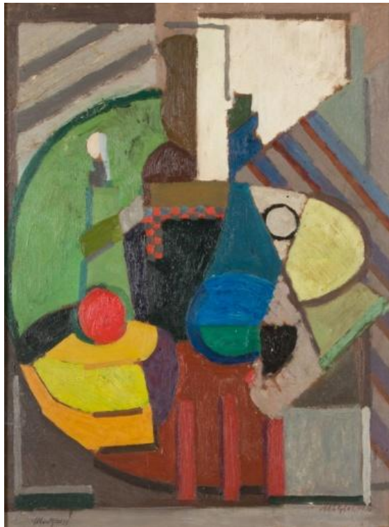
Albert Gleizes. Nature morte aux bouteilles , 1916. Colección particular