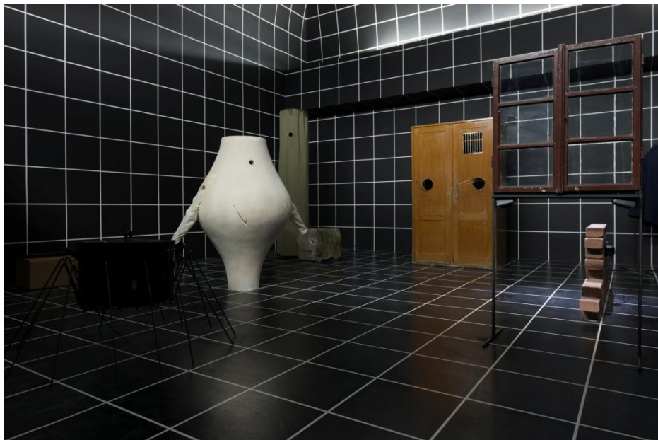
Eva Kotatkova, El teatro de los objetos , 2013

El nacimiento del objeto es el título de una fotografía del surrealista belga Paul Nougé, en la que un grupo de personas observa el vacío como si tuviera que aparecer algo en cualquier momento. Eva Kotatkova toma prestado el título para su proyecto, que reflexiona alrededor de la relación entre objetos y personas en un contexto institucional. La artista se centra en objetos accesorios o mediadores –aquellos objetos que generan una relación de seguridad o dependencia como los muñecos para los niños, los objetos personales o heredados– y en objetos que nos limitan, nos guían o nos deforman –muebles para que nuestro cuerpo adopte una postura específica, ropa que afecta a la circulación o elementos de instituciones que tratan de mantener el control. A partir de todos esos objetos, Kotatkova desplaza esta relación a la esfera de los comportamientos del público en varias instituciones.