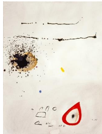
Joan Miró Tête Cabeza 1940-1974 Acrílico sobre tela 65 x 50 cm Fundació Joan Miró, Barcelona