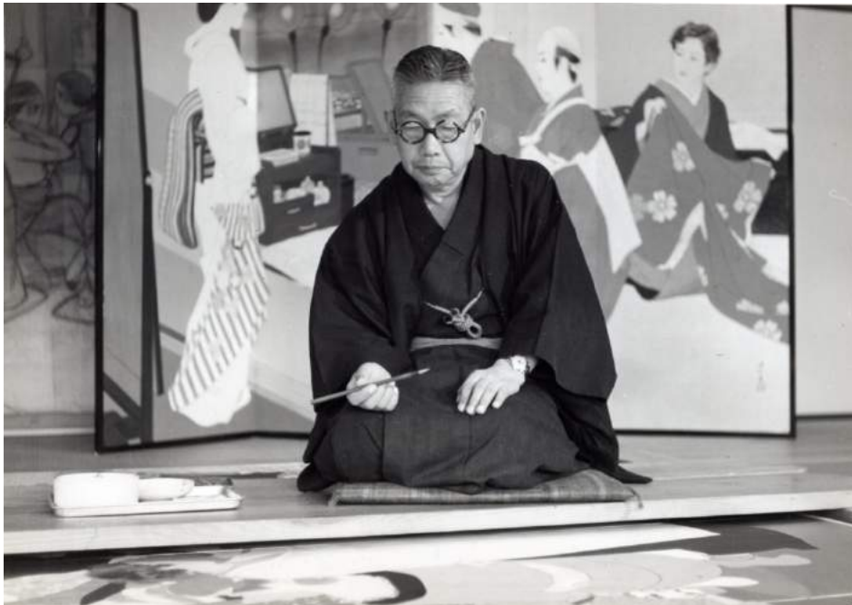
Itō Shinsui, c. 1954

Nascut a Tòquio l'any 1898, Itō Shinsui va créixer durant un període d'intenses transformacions. Encara que molts artistes japonesos ja s'estaven formant seguint els mètodes moderns en acadèmies d'art de tall occidental, Shinsui es va educar segons la relació tradicional mestre-deixeble. Als tretze anys va ser acceptat com a alumne per Kaburagi Kiyokata (1878-1972), un dels pintors més distingits del seu temps. Entre els quinze i els disset anys, Shinsui va donar mostres d'un talent prodigiós i va ser convidat a participar en exposicions organitzades pel Ministeri d'Educació japonès o per associacions privades d'artistes, en les quals va rebre distincions i premis. L'any 1915, l'editor Watanabe Shōzaburō va descobrir un retrat femení seu en una exposició col·lectiva. Captivat per l'obra, es va dirigir al jove artista a través del seu mestre per proposar-li de convertir la pintura en una creació per a una estampa. Davant del mirall , que va aparèixer l'any següent, va marcar l'inici d'una fructífera col·laboració de quaranta anys.