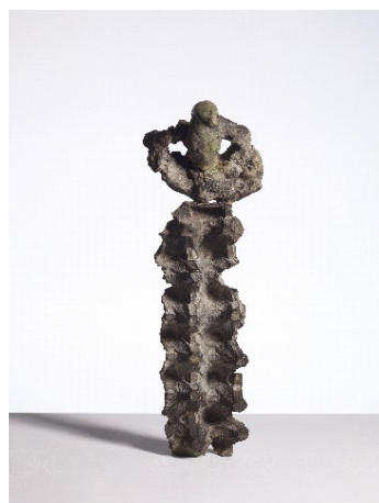
Joan Miró. Muchacha, 1967. Fundació Joan Miró, Barcelona.