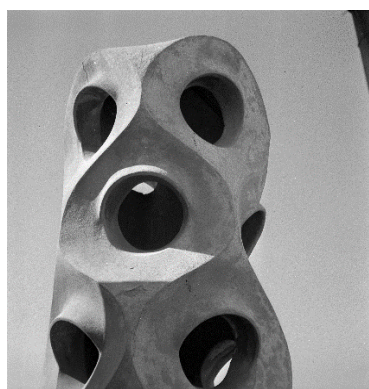
Joaquim Gomis. Detalle de una de las chimeneas de la terraza de La Pedrera. Fondo Joaquim Gomis, depositado en el Arxiu Nacional de Catalunya. © Herederos de Joaquim Gomis. Fundació Joan Miró, Barcelona.