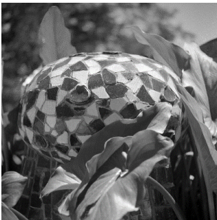
Joaquim Gomis. Detalle de los adornos cerámicos con trencadís del Park Güell. Fondo Gomis, depositado en el Arxiu Nacional de Catalunya. © Herederos de Joaquim Gomis. Fundació Joan Miró, Barcelona