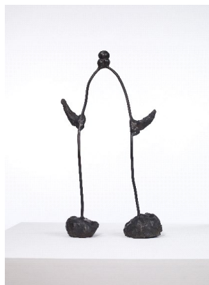
Joan Miró. Mujer, 1970. Fundació Joan Miró, Barcelona.