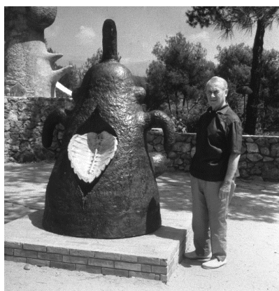
Joaquim Gomis. Retrato de Joan Miró posando al lado de su escultura Déesse , 1963, en el laberinto de la Fondation Maeght de Saint-Paul-de-Vence, Francia. Fondo Gomis, depositado en el Arxiu Nacional de Catalunya. © Herederos de Joaquim Gomis. Fundació Joan Miró, Barcelona.