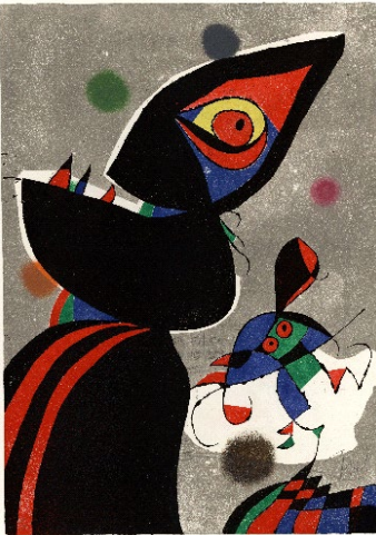
Joan Miró. Gaudí XVII, 1979. Fundació Joan Miró, Barcelona.