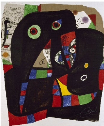
Joan Miró. Gaudí XX, 1979. Fundació Joan Miró, Barcelona.