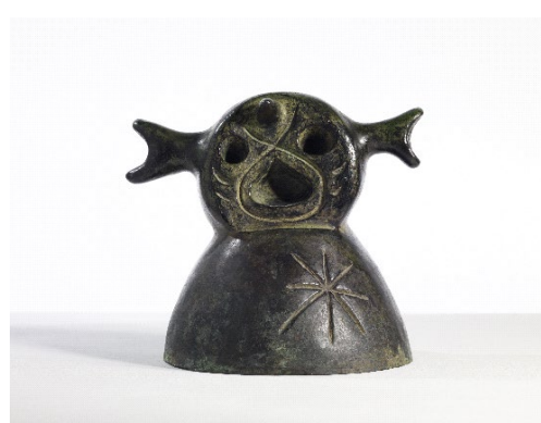
Joan Miró. Tête, 1949. Fundació Joan Miró, Barcelona.