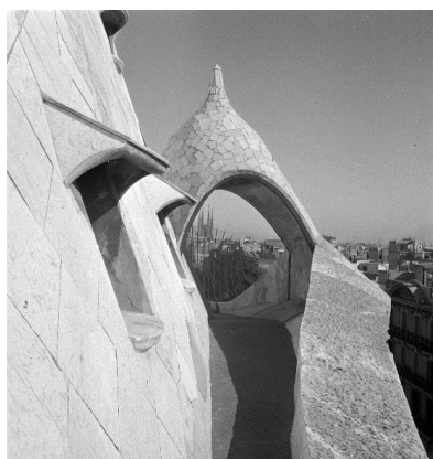
Cerámica, piedra y mármol en la terraza de La Pedrera.

Miró entiende el arte como una expresión vinculada a la vida cotidiana. Es por tal motivo que ambiciona trabajar en los espacios públicos. La cerámica y la escultura le permiten materializar esta idea, y el arte de la prehistoria, el arte románico y Gaudí le sirven de referente. Cuando Miró, junto con Josep Llorenç Artigas, crea el Laberinto de la Fondation Maeght, se inspira en el Park Güell. También se fija en Gaudí a la hora de buscar materiales resistentes a la intemperie, como por ejemplo el trencadís.