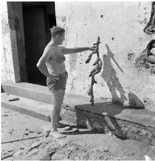
Joan Miró contemplando una raíz en la playa de Mont-roig, Tarragona, c. 1946-1950. Fondo Gomis, depositado en el Arxiu Nacional de Catalunya. Fundació Joan Miró, Barcelona.