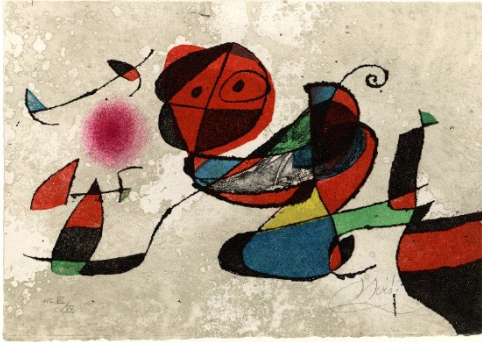
Joan Miró. Gaudí XIII, 1979. Fundació Joan Miró, Barcelona.

Miró decide rendir homenaje a Gaudí con una serie de veintiún gravados. Una sucesión de personajes fantásticos se van estructurando a partir del grafismo de los negros y de los escaqueados de color, con una marcada insistencia en las líneas curvas y onduladas. A través de los recursos que le ofrece el grabado, Miró evoca claramente la técnica gaudiniana del trencadís, hecho con trozos de cerámica reutilizados.