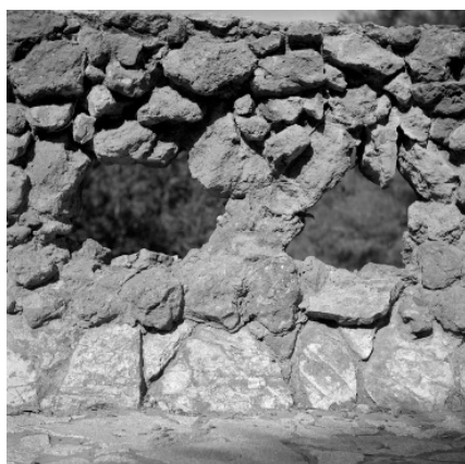
Joaquim Gomis. Detall d'un mur de pedra del Park Güell, 1943. Fons Gomis, dipositat a l'Arxiu Nacional de Catalunya. © Hereus de Joaquim Gomis. Fundació Joan Miró, Barcelona.