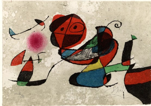
Joan Miró. Gaudí XIII, 1979. Fundació Joan Miró, Barcelona.

Miró decideix retre homenatge a Gaudí amb una sèrie de vint-i-un gravats. Un seguit de personatges fantàstics es van estructurant a partir del grafisme dels negres i dels escacats de color, amb una marcada insistència en les línies corbes i ondulades. A través dels recursos que li ofereix el gravat, Miró evoca clarament la tècnica gaudiniana del trencadís, feta amb bocins de ceràmica reutilitzats.