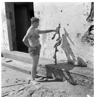
Joan Miró contemplant una arrel a la platja de Mont-roig, Tarragona, c. 1946-1950. Fundació Joan Miró, Barcelona.