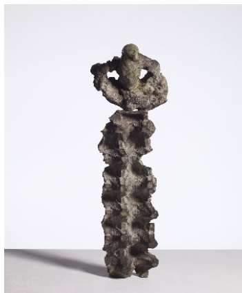
Joan Miró. Vaileta, 1967. Fundació Joan Miró, Barcelona.