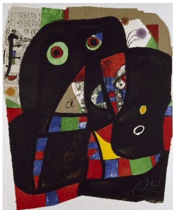
Joan Miró. Gaudí XX, 1979. Fundació Joan Miró, Barcelona.