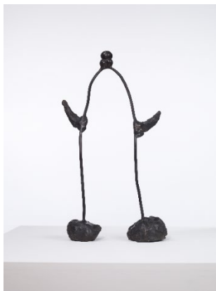
Joan Miró. Dona, 1970. Fundació Joan Miró, Barcelona.