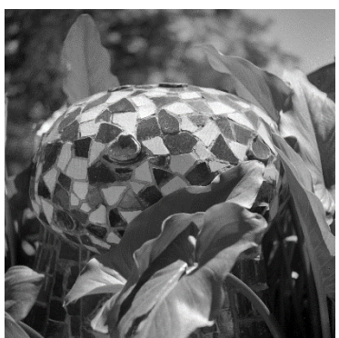
Joaquim Gomis. Detall dels ornaments ceràmics amb trencadís del Park Güell. Fons Gomis, dipositat a l'Arxiu Nacional de Catalunya. © Hereus de Joaquim Gomis. Fundació Joan Miró, Barcelona.