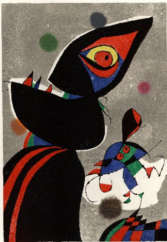
Joan Miró. Gaudí XVII, 1979. Fundació Joan Miró, Barcelona.