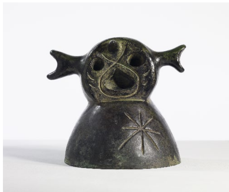
Joan Miró. Tête, 1949. Fundació Joan Miró, Barcelona.