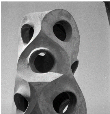
Joaquim Gomis. Detall d'una de les xemeneies de la terrassa de la Pedrera. Fons Joaquim Gomis, dipòsit a l'Arxiu Nacional de Catalunya. © Hereus de Joaquim Gomis. Fundació Joan Miró, Barcelona.