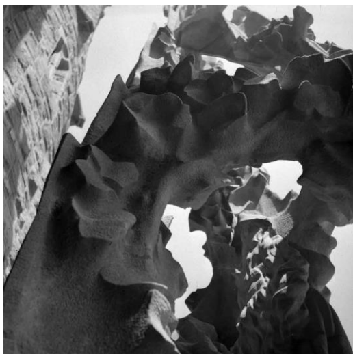
Detalle de la linterna de la Fe del Temple de la Sagrada Família, 1946.