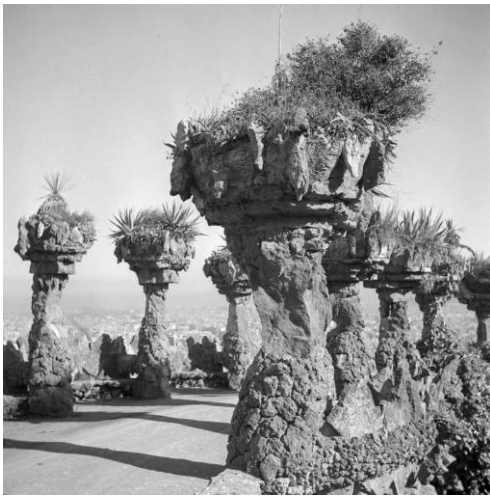
Joaquim Gomis. Vista de un camino con columnas jardineras del Park Güell , 1946.

Fons Joaquim Gomis, depositado en el Arxiu Nacional de Catalunya.