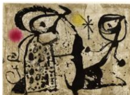
Joan Miró. Estela de doble cara, 1956, y Gaudí XIX, 1979. Fundació Joan Miró, Barcelona.