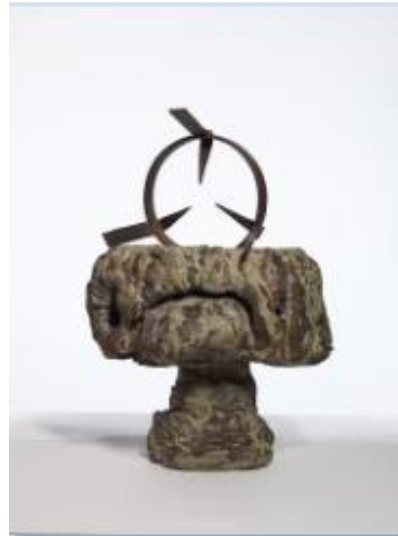
Joan Miró. Testa coronada , 1970.

Fons Joaquim Gomis, depositado en el Arxiu Nacional de Catalunya.