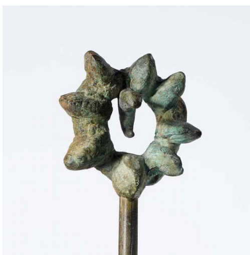
Joan Miró. Mujer sol , 1966 (detall). Fundació Joan Miró, Barcelona.