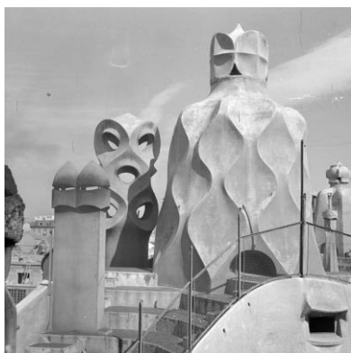
Joaquim Gomis. Vista de Chimeneas, claraboyas y torres de ventilación en la terraza de la Pedrera, 1946. Fons Joaquim Gomis, depositado en el Arxiu Nacional de Catalunya.

Fons Joaquim Gomis, depositado en el Arxiu Nacional de Catalunya.