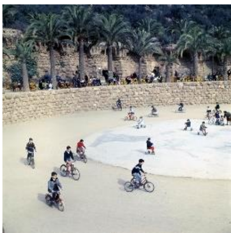
Joaquim Gomis. Vista de la plaza principal del Park Güell con un grupo de niños en bicicleta , 1967.

Fons Joaquim Gomis, depositado en el Arxiu Nacional de Catalunya.