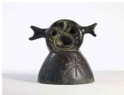
Joan Miró. Tête, 1949. Fundació Joan Miró, Barcelona.