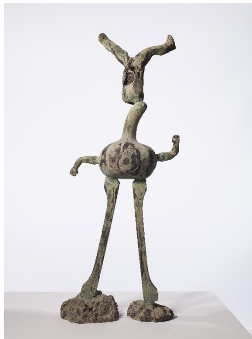
Joan Miró. El equilibrista , 1969.