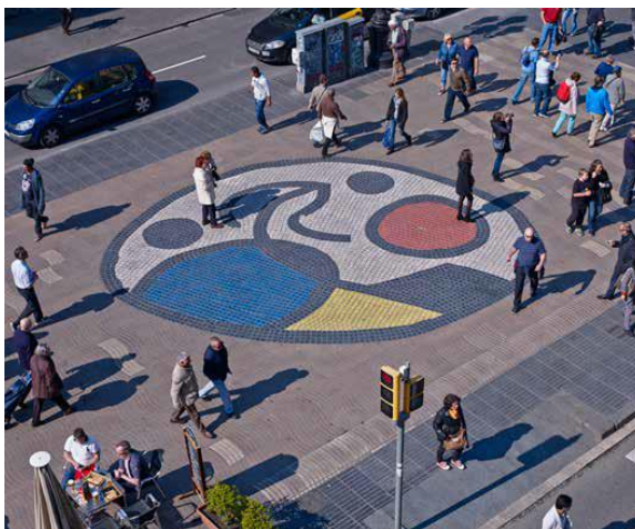
Joan Miró. Mosaico del Pla de l'Ós en la Rambla de Barcelona , 1976.