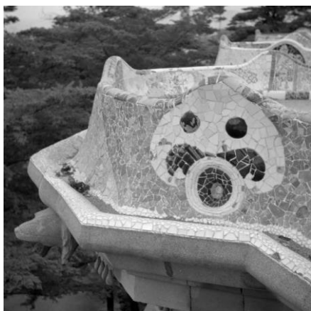
Joaquim Gomis. Detalle del trencadís de la barandilla del banco de la plaza del Park Güell, 1946. Fons Joaquim Gomis, depositado en el ANC