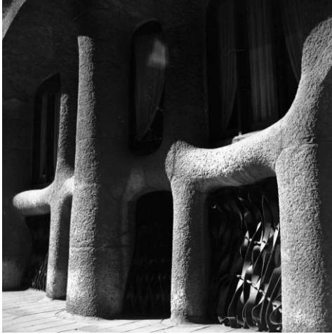
Joaquim Gomis. Detalle de la fachada de la Pedrera , 1946. Fons Joaquim Gomis, depositado en el Arxiu Nacional Catalunya.