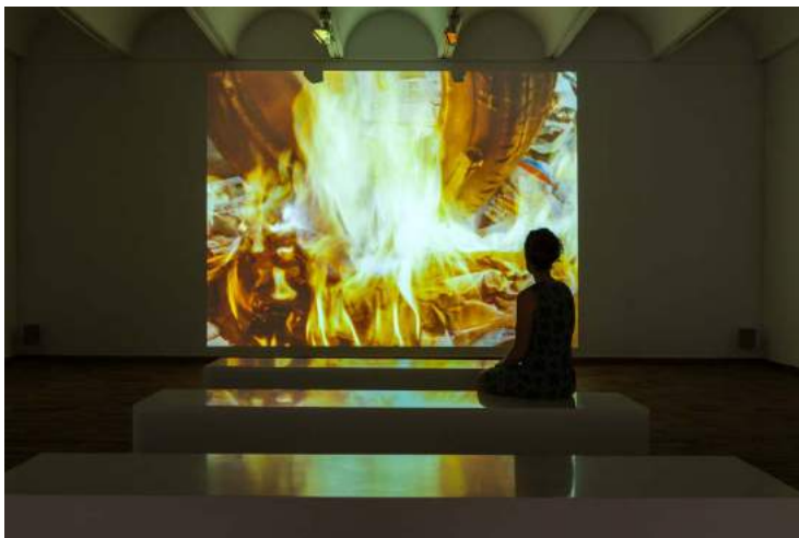
Peter Fischli i David Weiss The Way Things Go 1985-1987 Videoprojecció, 31 min

Rodes, escales, espelmes, barrils, marcs i una multitud d'objectes que remeten a la quotidianitat, però també a les pràctiques pictòriques de l'època, roden, cauen, cremen, xoquen. Els objectes i les accions que duen a terme en són els protagonistes. Aquests objectes no es troben separats entre ells sinó connectats, cadascun esperant pacientment a ser activat per l'element precedent i, al seu torn, activant el següent en un llarg viatge seguit per la càmera. Es relacionen entre ells seguint el seu curs amb una certa independència de les mans humanes que els van col·locar diverses vegades fins que van respondre com esperaven, les mans que els van filmar, les que van editar la successió de més de vint preses diferents per simular el pla seqüència final. Els artistes suïssos van dissenyar The Way Things Go com una mena de màquina de Rube Golberg a gran escala, un aparell excessivament complex conformat per una sèrie d'artefactes connectats linealment que no fa cap altra cosa que mostrar una successió de causa i efecte sense cap conclusió. Soterradament, van deixar-hi escrita també una resposta àcida al sistema artístic del moment i les pràctiques pictòriques postconceptuals.