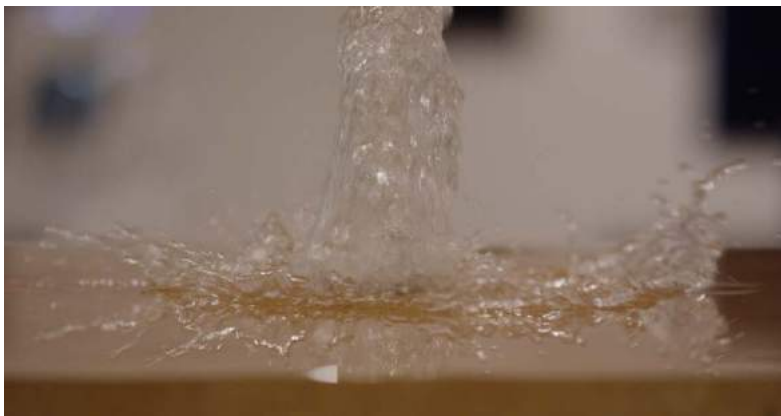
Cécile B. Evans Leaks . 2017 Fotogrames del film.