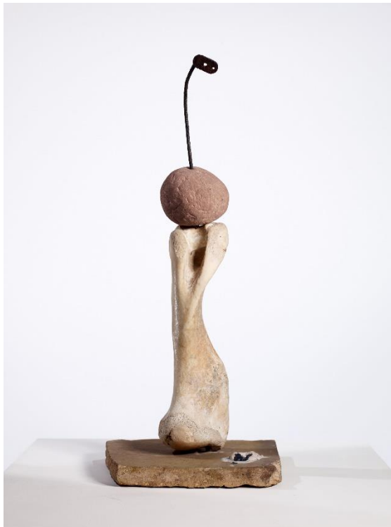
Joan Miró. Dona , 1946

Aquesta exposició monogràfica explora per primera vegada de forma específica el paper de l'objecte en l'obra de Joan Miró. Comissariada per William Jeffett, Miró i l'objecte investiga com l'artista evoluciona des de la representació pictòrica de l'objecte de la primera fase, fins a la incorporació física de l'objecte en l'obra, passant per l'ús de tècniques com el collage.