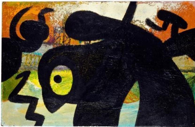
Joan Miró. Personnage, oiseaux , 1973. Fundació Joan Miró, Barcelona

24 de maig – 16 d'agost de 2015 | 2 de setembre – 14 de novembre de 2015