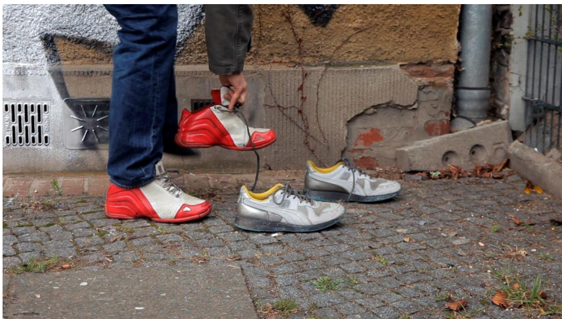
Fotograma de Trucking, 2015