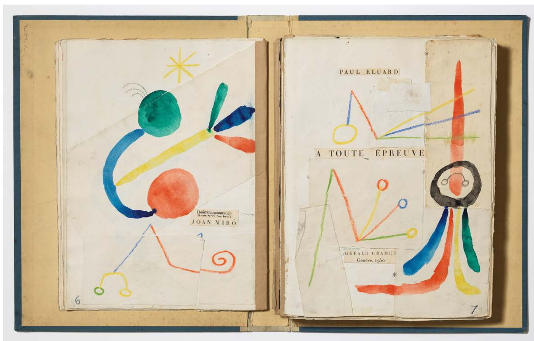
Maqueta del libro À toute épreuve, (1948-1958), Joan Miró.