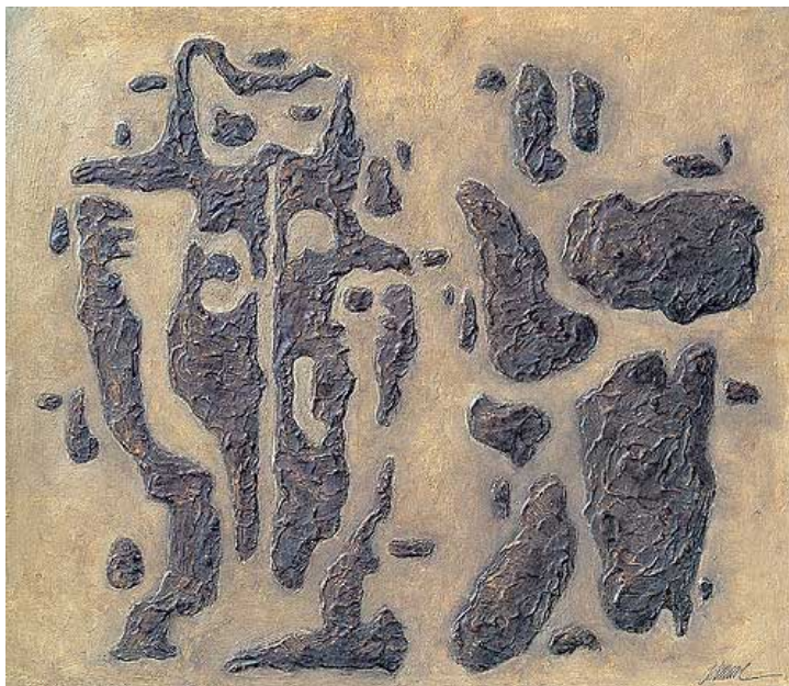
Willi Baumeister, Gilgamesch und Enkidu (Gilgamesh et Enkidu), 1943, Archiv Baumeister im Kunstmuseum Stuttgart

Sumer y el paradigma moderno investiga el interés que las «artes» de Mesopotamia de entre el cuarto y el tercer milenio antes de Cristo suscitaron en algunos de los artistas más destacados del siglo XX. Conocido con frecuencia como arte sumerio, el corpus de hallazgos arqueológicos procedentes del sur de Irak, bajo mandato británico desde la caída del imperio otomano hasta el final de la Primera Guerra Mundial, se convirtió en el foco de atención para historiadores, antropólogos e intelectuales a partir de finales de los años veinte. Su apreciación de los objetos y materiales que procedían de aquella región fue fundamental para otorgarles el estatus de obras de arte. Paralelamente, los hallazgos influyeron en el desarrollo de un lenguaje característico del arte moderno, como puede observarse en la obra de Henry Moore, Alberto Giacometti y Joan Miró.