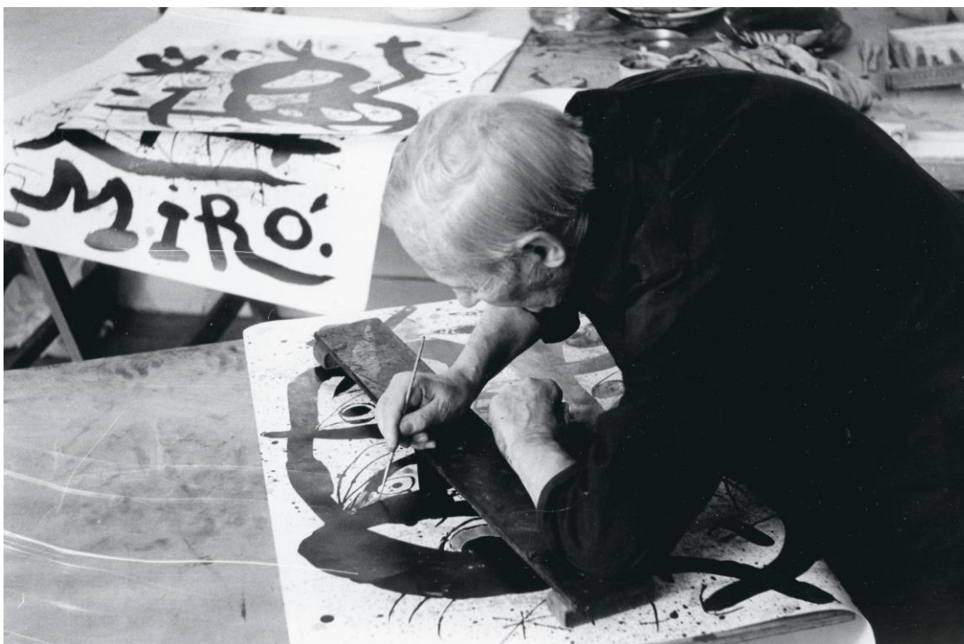
Joan Miró preparant un cartell, 1972

Gràcies a les explicacions en vídeo, també es podrà participar virtualment en el taller fent un dibuix, un collage, una fotografia o un disseny digital que mostri el compromís amb una causa concreta i publicant-lo a Instagram amb la menció @fundaciomiro i l'etiqueta #lamevacausa. Totes les reivindicacions es penjaran al tauler de Pinterest de la Fundació.