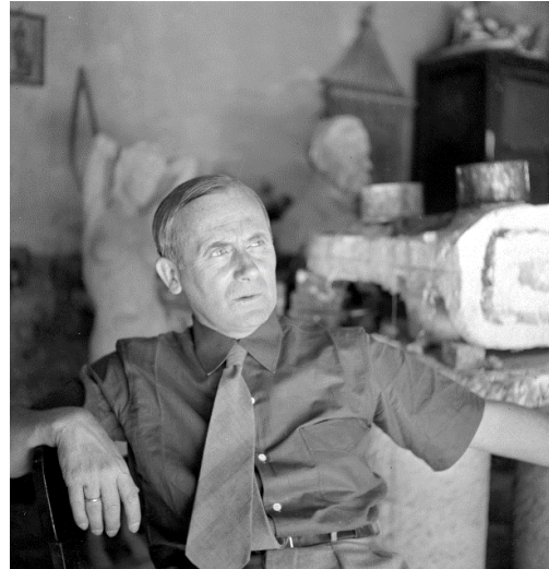
Joaquim Gomis. Retrato de Joan Miró 1944. Fondo Joaquim Gomis, depositado en el Arxiu Nacional de Catalunya. © Herederos de Joaquim Gomis. Fundació Joan Miró, Barcelona, 2019

Imágenes disponibles en http://bit.ly/UniversMiró